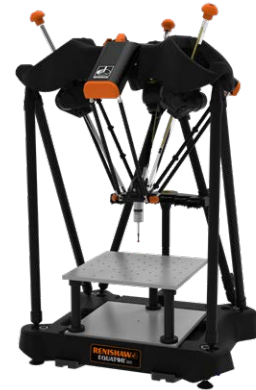
Sistema de medição Equator™ 300