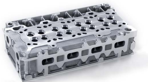
Cabeçote do motor após a usinagem de cubagem

"Como uma empresa que opera em um mercado verdadeiramente global, lutamos todos os dias para nos destacar e ficar à frente da concorrência. Os investimentos em novos métodos e técnicas de produção não envolvem apenas eficiência, qualidade e eliminação de perdas, mas também em tornar nosso serviço mais atraente e interessante e em antecipar as necessidades futuras dos clientes".