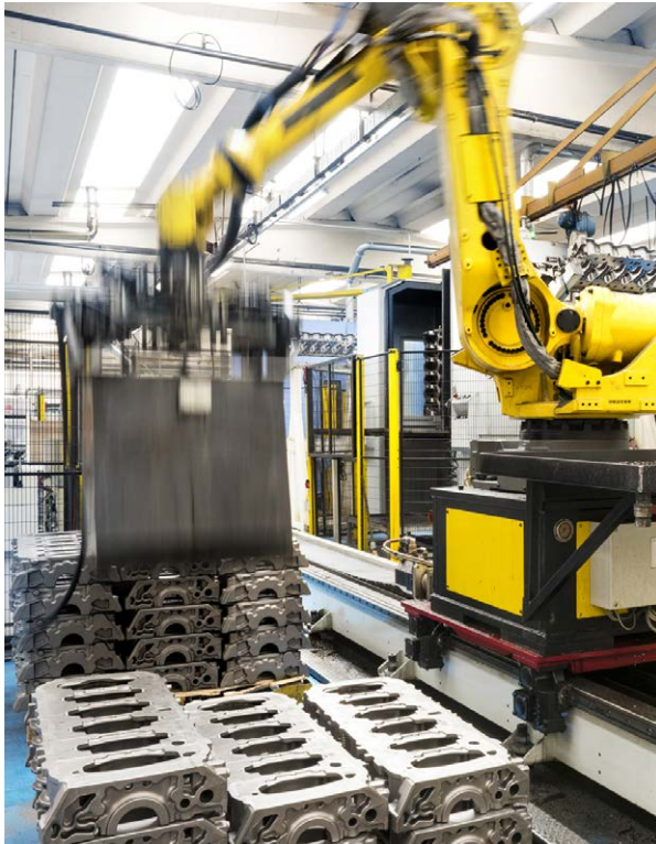
OMG é especializada em usinagem mecânica de peças metálicas

A qualidade, é claro, é uma pedra angular essencial do negócio da OMG. Muito antes do advento das normas globais de qualidade, a empresa já havia criado seus próprios métodos, verificações e documentação para garantir conformidade com a tolerância e consistência de fabricação. Hoje, a empresa é certificada pelas normas automotivas e ambientais ISO exigidas.